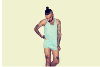
Schlicht sind die Unterhemden, die das iranische Label "Do Fard" herstellt

Nachdem Ajatollah Khomeini an die Macht gekommen war, sollte die Unterwäsche einen iranischen Namen bekommen. In "Do Fard" – "Zwei Individuen" wurde sie umbenannt. Das klang zumindest wie der alte Name, der durchgestrichen noch heute auf der Rückseite des eingenähten Schildchens zu finden ist. Sogar ein Bezug zu Deutschland ist in dem Geschäft in Teheran zu finden: Werbung mit dem deutschen Slogan "Aus erstklassigen Garnen hergestellt".