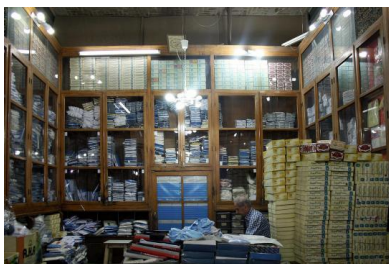
Im Großen Basar von Teheran werden die Unterhosen und Unterhemden von "Do Fard" verkauft

Ab sofort kann jeder einen Teil der Kunstaktion kaufen – in Berlin oder im Internet . Unterhosen sind ab elf Euro zu haben und Unterhemden ab 16 Euro. Ein Kunstprojekt oder vielleicht eher ein Bestseller? Das wird sich bis zum 9. August zeigen, so lange läuft die Aktion.