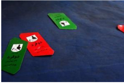
Nach der Islamischen Revolution von 1979 musste das Label seinen französischen Namen in einen iranischen ändern