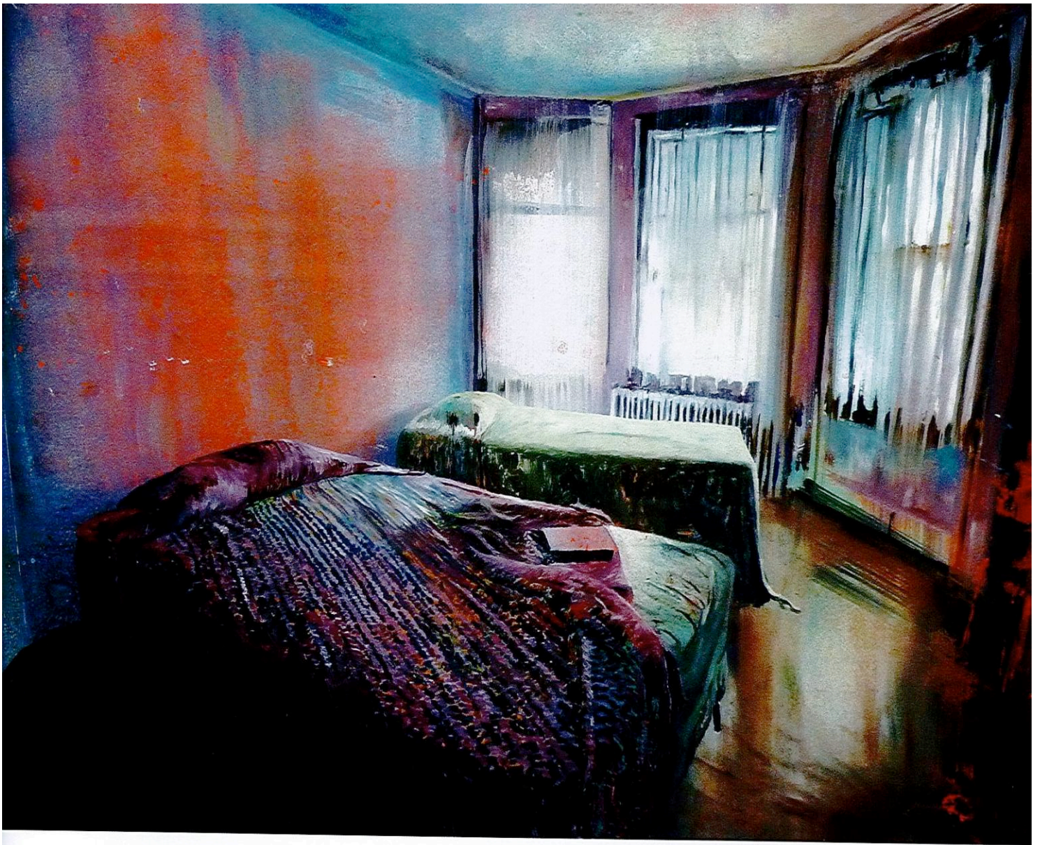
Gil Heitor Cortesao, Double Bed, Oil on plexi glass, 42 x 60 cm, 2010

除了吸引众多享誉国际的艺廊外，迪拜艺术博览会亦是促进来自全球各地参加者了解中东、北非与南亚地区（MENASA）之良机，并让这些地区不断增长的收藏家发掘更多元的艺术新面貌。为此，大会特别邀请英国艺术中心Arnofini策展人Nav Haq在展场内设立五个与别不同的艺术空间，呈现亚洲及中东新兴的艺术风貌，当中大部分属首次在艺术博览会中展出；同时，更带来个别艺术家旨在对博览会现场作出回响的最新创作项目，别树一帜。